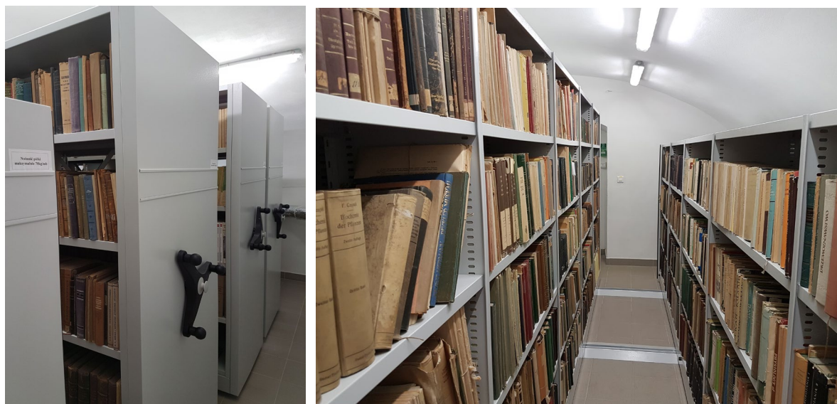
Ryc. 7.2. Zbiory biblioteki PTB w nowych pomieszczeniach