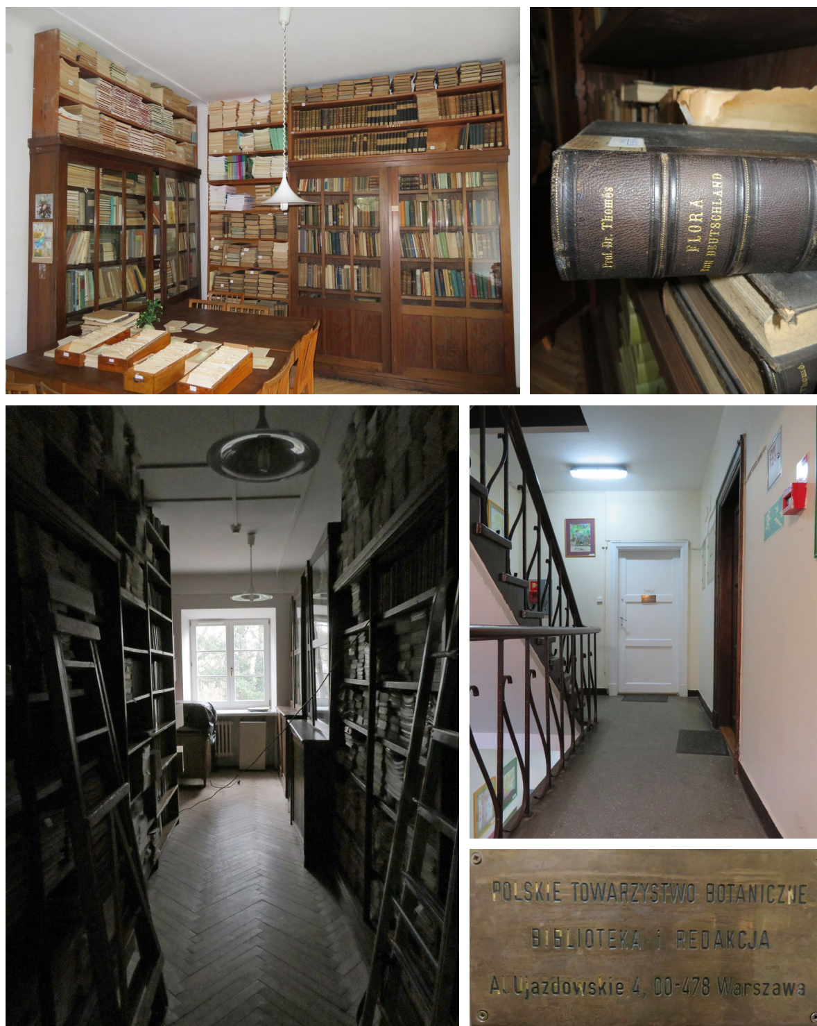
Ryc. 7.7. Zmierzch biblioteki jaką znamy, do jakiej z sentymentem wracamy

* Autor opracowania pełnił następujące funkcje w PTB: zastępcy skarbnika ZG, skarbnika ZG, prezesa, członka prezydium ZG kilku kadencji, opiekuna biblioteki, członka Rad Redakcyjnych czasopism PTB i był również inicjatorem powołania sekcji Kultur Tkankowych i jej wieloletnim przewodniczącym. Jest emerytowanym profesorem PAN OB-CZRB w Powsinie, Warszawa.