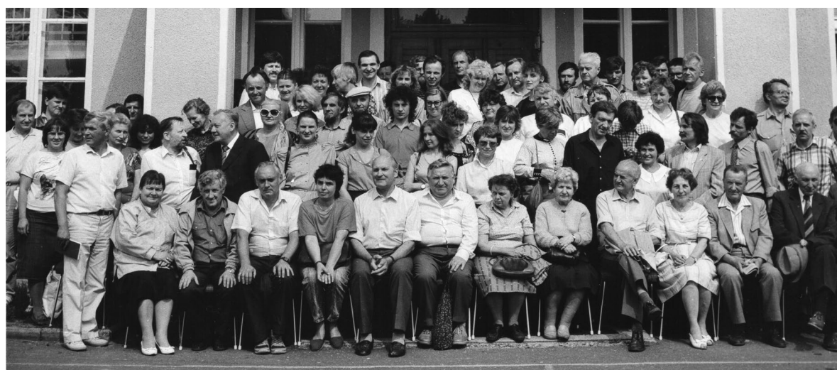
Ryc. 11.1.8. Zjazd Sekcji Dendrologicznej PTB, konferencja Stare drzewa, ich pielęgnacja i ochrona oraz Nowe gatunki i odmiany drzew i krzewów oraz ich rozmnażanie , Kórnik, 24–26 V 1990 r.