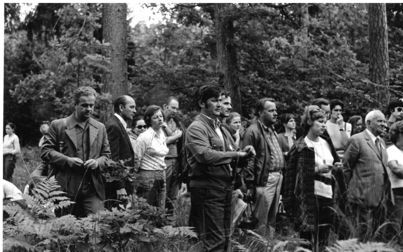
Ryc. 11.1.3. Zjazd Sekcji Dendrologicznej PTB i Zjazd Dendrologiczny Polsko-Czechosłowacki Parki narodowe, ich rola i wykorzystanie , Białowieża–Olsztyn–Kortowo, 11–16 VII 1974 r.