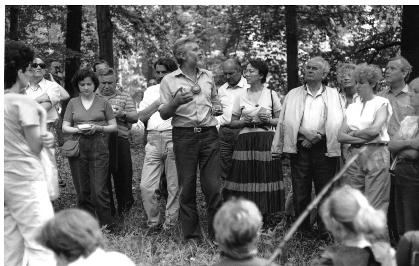
Ryc. 11.1.7. Zjazd Sekcji Dendrologicznej PTB, konferencja Flora drzewiasta Karpat Wschodnich i jej przemiany , Przemyśl–Bolestraszyce, 9–13 VI 1988 r.