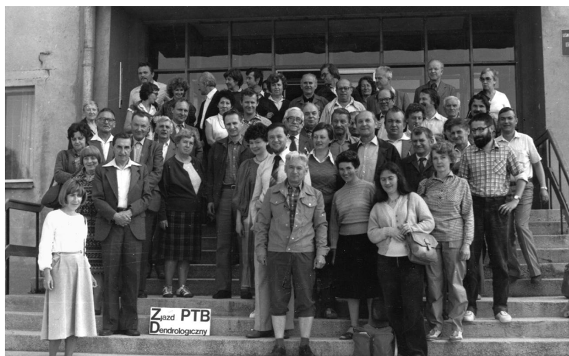
Ryc. 11.1.5. Zjazd Sekcji Dendrologicznej PTB, Konferencja Uprawa obcych gatunków drzew w lasach oraz zagrożone i ginące rośliny drzewiaste w Polsce , Łaski koło Kępna, 1–3 VI 1984 r.