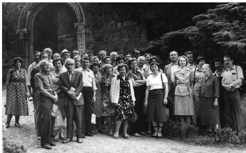
Ryc. 11.1.4. Zjazd Sekcji Dendrologicznej PTB, konferencja Uprawa krzewów ozdobnych z rodziny wrzosowatych Ericaceae , 5–7 VI 1981 r. (fot. J. Hereźniak)