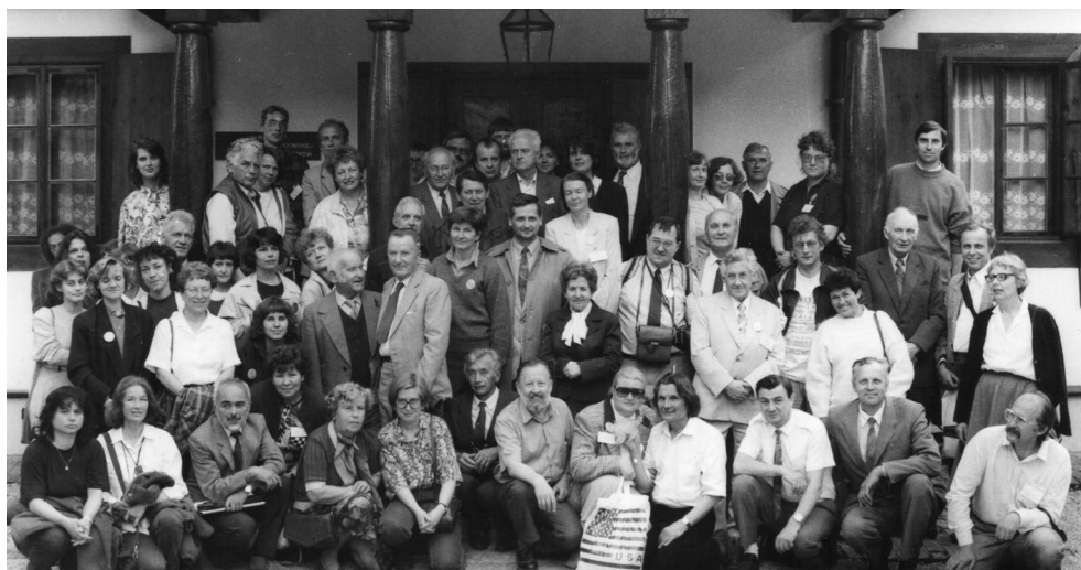
Ryc. 11.1.10. Zjazd Sekcji Dendrologicznej PTB, Lublin, 8–9 VI 1994 r.