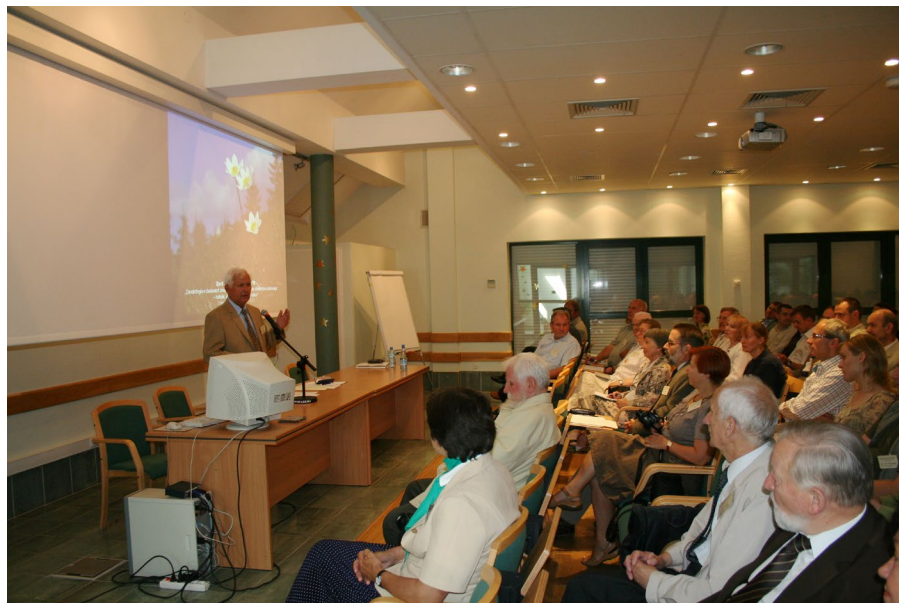
Ryc. 11.1.13. Zjazd Sekcji Dendrologicznej PTB, konferencja Dendrologia w badaniach środowiska przyrodniczego oraz dziedzictwa kulturowego , Szklarska Poręba, 25–27 VI 2008 r.

badań był Instytut Dendrologii w Kórniku. Wyniki były publikowane m.in. w Roczniku Sekcji Dendrologicznej PTB oraz czasopiśmie Arboretum Kórnickie (obecnie Dendrobiology ).