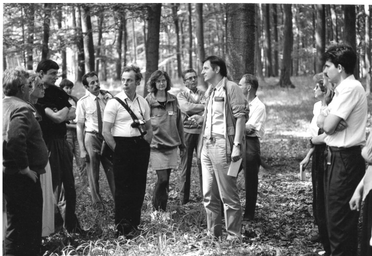
Ryc. 11.1.9. Zjazd Sekcji Dendrologicznej PTB, konferencja Drzewa i krzewy w zmieniającym się środowisku , Zielonka, 11–12 VI 1992 r.