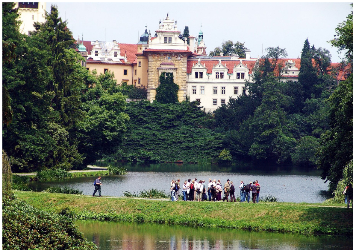
Ryc. 11.1.12. Uczestnicy sesji terenowej Zjazdu Sekcji Dendrologicznej PTB w Szklarskiej Porębie, Arboretum w Pruhonicach koło Pragi, czerwiec 2008 r.

W 1955 roku w ramach Sekcji powołano Komisję, której zadaniem było dokonanie rejestracji wybranych obiektów godnych ochrony i zabezpieczenia przed zniszczeniem. W wyniku tej akcji powstały całościowe opracowania dendrologiczne w województwach koszalińskim, szczecińskim i gdańskim, a wojewódzcy konserwatorzy przyrody formalnie ustanowili ochronę arboretów m.in. w Wojsławicach, Przelewicach czy Nietkowie.