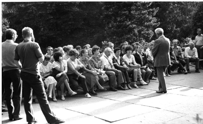
Ryc. 11.1.6. Zjazd Sekcji Dendrologicznej PTB, konferencja Rola arboretów w introdukcji nowych gatunków i odmian drzew i krzewów , Rogów, 9–11 VI 1986 r.