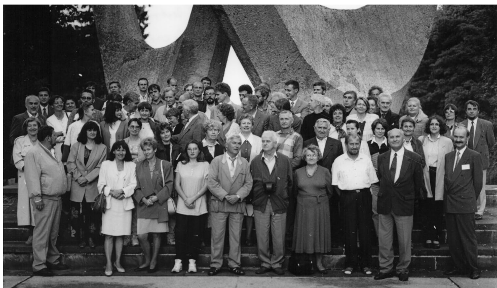
Ryc. 11.1.11. Zjazd Sekcji Dendrologicznej PTB, Szczecin, 3–5 IX 1996 r.