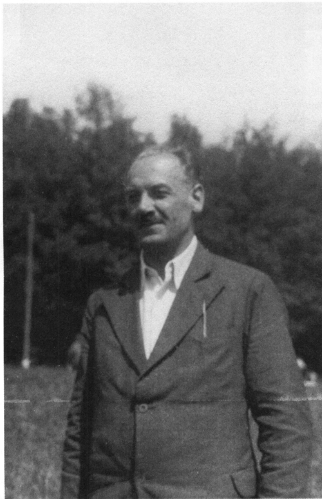
Fotografia o wym. 8,5 × 13,5 cm.

Jan ZERNDT (1894–1945) – paleobotanik, geolog, absolwent Uniwersytetu Jagiellońskiego, długoletni nauczyciel szkół średnich w Łodzi i Krakowie, współpracownik Komisji Fizjograficznej Polskiej Akademii Umiejętności i Państwowego Instytutu Geologicznego, jeden z pionierów badań nad megasporami roślin z okresu karbońskiego.