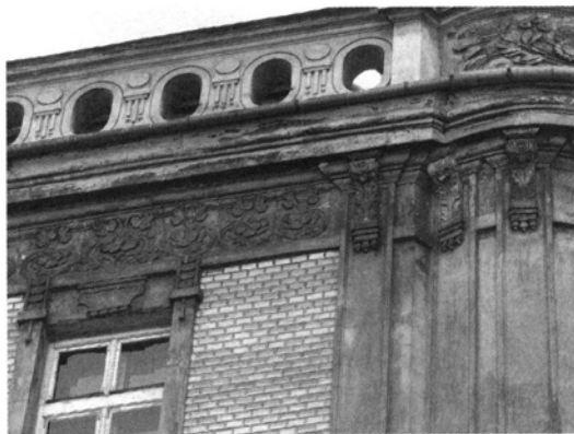
Ryc. 5–6. Dekoracja kamienicy przy ul. Dietla 31, Fig. 5–6. Decoration of tenement house at 31, Dietla St.

z makówkami, słonecznikami i przepiórkami wydziobującymi z ziemi pożywienie. Elewacje wykonano z różnych materiałów, częściowo w nietynkowanej białej i czerwonej cegle. Mak już ok. 3000 lat p.n.e. uznany został przez Sumerów za świętą roślinę, której przypisywano właściwości magiczne i otaczano szczególną czcią. W Krakowie motywy słonecznika zdobią szczyt narożnika kamienicy z 1908 r. przy ul. Dietla 31, fryz międzyokienny przy ul. Kołłątaja 12, wspornik balkonu przy ul. Łobzowskiej 4 zdobi kwiat słonecznika oraz portal przy ul. Szujskiego 7, na którym pojawiają się także motywy borówki.