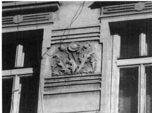
Ryc. 3–4. Dekoracja kamienicy przy ul. Orzeszkowej 2.