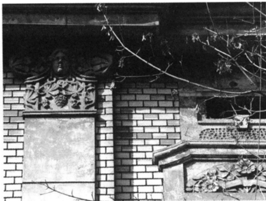
Ryc. 1–2. Dekoracja kamienicy przy ul. Grabowskiego 3.