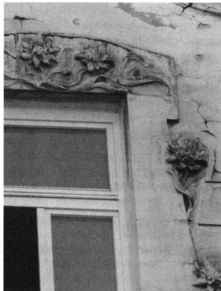
Ryc. 11–12. Dekoracja kamienicy przy Al. Krasińskiego 15.