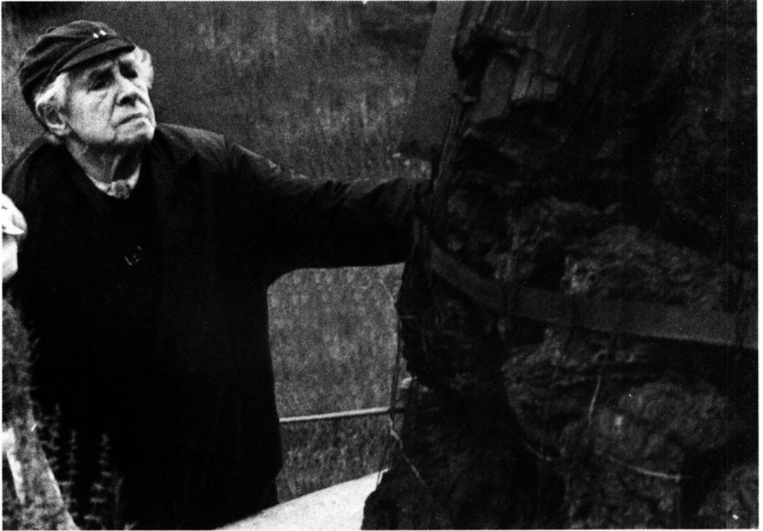
Hanna Czeczottowa przed pniem Cupressinoxylon sp. wydobytym z nadkładu węgla brunatnego kopalni Turów, 1974 r. Fotografia, 9,2 × 16,3 cm (Pracownia Fotograficzna Kopalni Węgla Brunatnego Turów, fot. Bolesław Dużyński). Właściciel: Dział Paleobotaniki Muzeum Ziemi PAN, Warszawa.

Hanna CZECZOTTOWA (1888–1982) – profesor nadzwyczajny Polskiej Akademii Nauk, dendrolog, fitosocjolog, paleobotanik, autor wielu prac, m.in. opracowań flory Azji Mniejszej, monografii na temat zmienności morfologicznej buka, graba, dębu, studiów nad genezą bursztynów bałtyckich; badacz flor trzeciorzędowych Polski, głównie miocenijskiej flory zagłębia brunatnowęglowego Turów. Współorganizatorka licznych ekspedycji przyrodniczych, m.in. do Ameryki Północnej, Wysp Kanaryjskich, Turcji, Mongolii, autorka bogatego zielnika dendrologicznego, zasłużona dzięki odkryciu klasycznych stanowisk flor kopalnych.