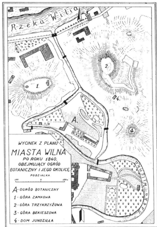
Ryc. 3. Plan Ogrodu Botanicznego na Sorokiszkach; po 1840 r. Fig. 3. Plan of Botanic Garden at Sorokiszki; after 1840.

rekonstruowany. Położony on jest na najniższej terasie zalewowej Wilii, na południe od stadionu Gintaras. Według informacji uzyskanych na miejscu, powierzchnia Ogrodu pierwotnie wynosiła 2 ha, a teraz – 7 ha. Ogród posiada jedną szklarnię wysoką na rośliny drzewiaste (Ryc. 5.) oraz trzy szklarnie niskie: kaktusiarnię, paprociarnię i mnożarkę. Jest zamknięty dla publiczności, czasem przychodzą studenci w ramach zajęć uniwersyteckich. Niezwykle trudna sytuacja ekonomiczna, w jakiej znalazła się Litwa po odzyskaniu niepodległości sprawiła, że zabrakło pieniędzy nie tylko na rozwój Ogrodu, ale nawet na opał. Tylko dzięki wysiłkom pracujących tam osób zgromadzone kolekcje roślin, a szczególnie tropikalnych, przetrwały okresy zimowych mrozów. W przyszłości, po zakończeniu odnawiania, Ogród Botaniczny na Zakrecie znów będzie przyciągał zwiedzających spragnionych kontaktu z egzotycznymi roślinami.