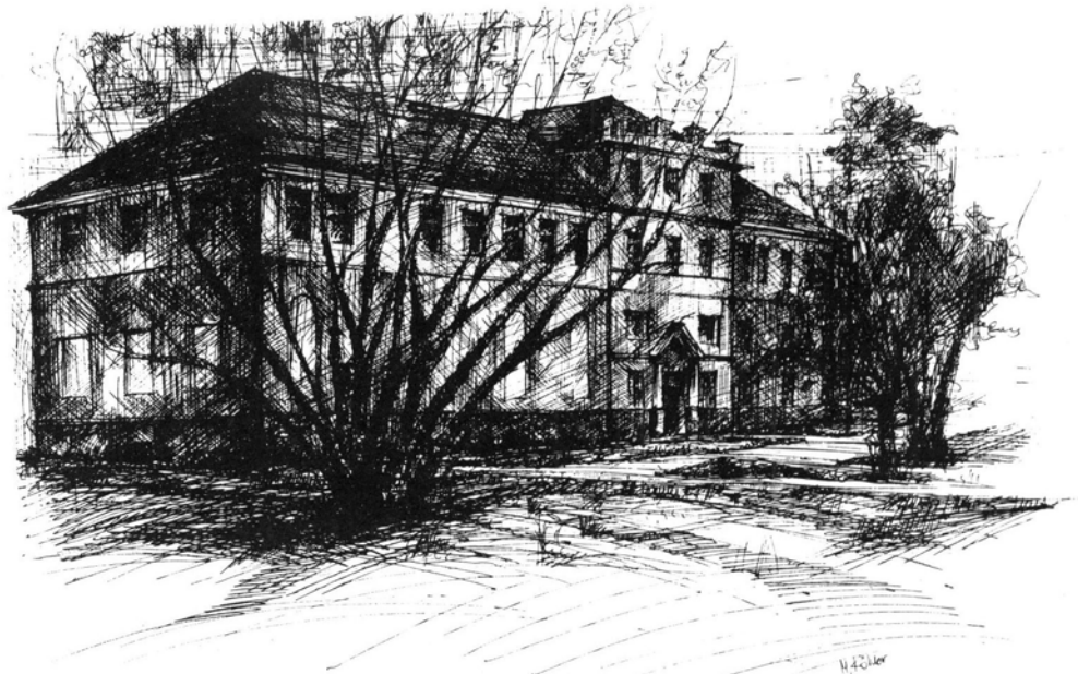
Ryc. 4. Budynek dawnej Katedry Historii Naturalnej; stan obecny. Fig. 5. Building of former Natural History Department; present state.