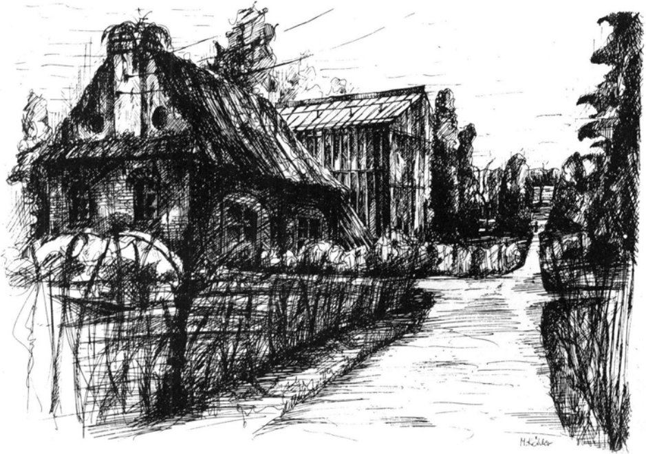
Ryc. 5. Fragment Ogrodu Botanicznego na Zakrecie – widok na szklarnię; stan obecny. Rycina piórkciem, Małgorzata Köhler, 1995.