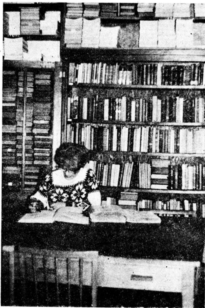
Ryc. 1. Czytelnia Biblioteki PTB

na specyficzny charakter Biblioteki. W zbiorach Biblioteki jest wiele pozycji, które wg danych Biblioteki Narodowej są jedynymi egzemplarzami w kraju, a to z kolei jest przyczyną stosunkowo dużej ilości wypożyczeń międzybibliotecznych, Biblioteka bowiem nie dysponuje kserografem.