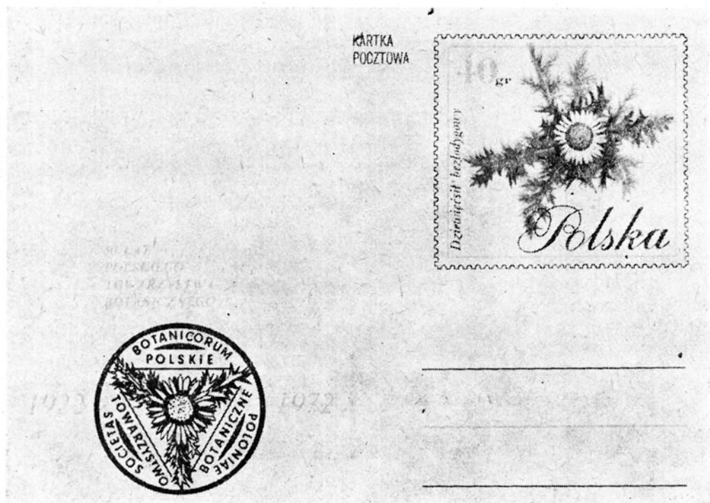
Ryc. 1. Kartka pocztowa wydana z okazji jubileuszu 50-lecia PTB