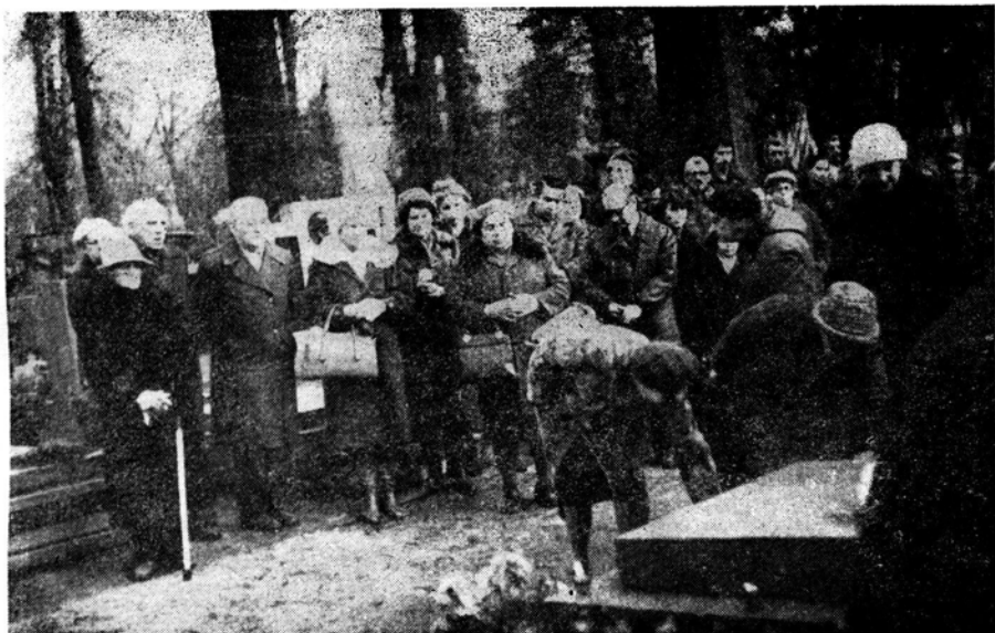
Ryc. 5. Złożenie kwiatów na grobie Profesora Władysława Szafera w dziesiątą rocznicę śmierci

Grób rodzinny, kamienny, w bardzo dobrym stanie ze słabo czytelnym napisem: „Władysław Szafer, profesor Uniwersytetu Jagiellońskiego, Botanik 1886—1970”. (Ba pfn. 6).