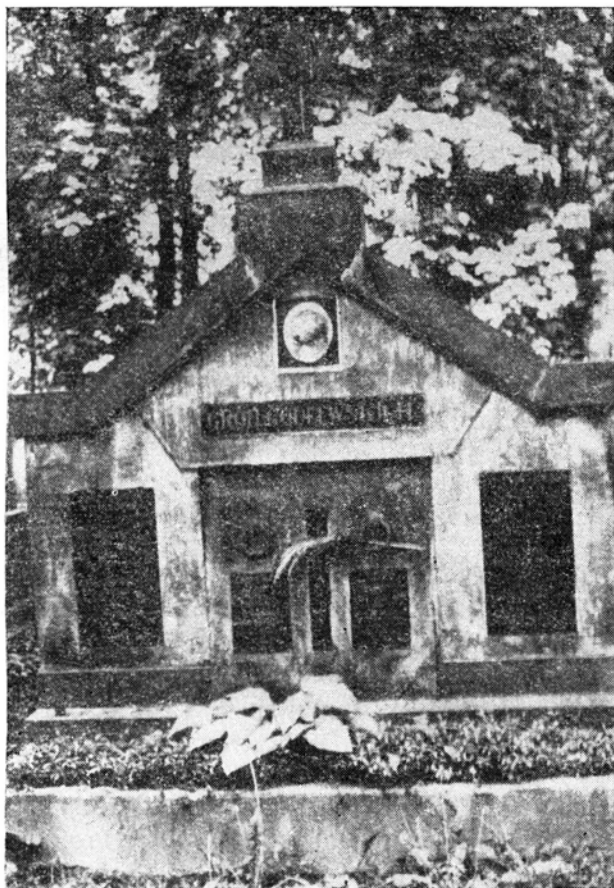
Ryc. 4. Grobowiec rodzinny Emila Godlewskiego

7. Roman Gutwiński (1860—1932) — adiunkt Ogrodu Botanicznego w latach 1882—1885. Nauczyciel gimnazjalny, jeden z pierwszych polskich algologów.