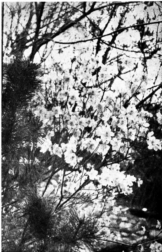
Ryc. 2. Rhododendron dauricum L. var. mucronulatum Maxim. Różanecznik dahurski