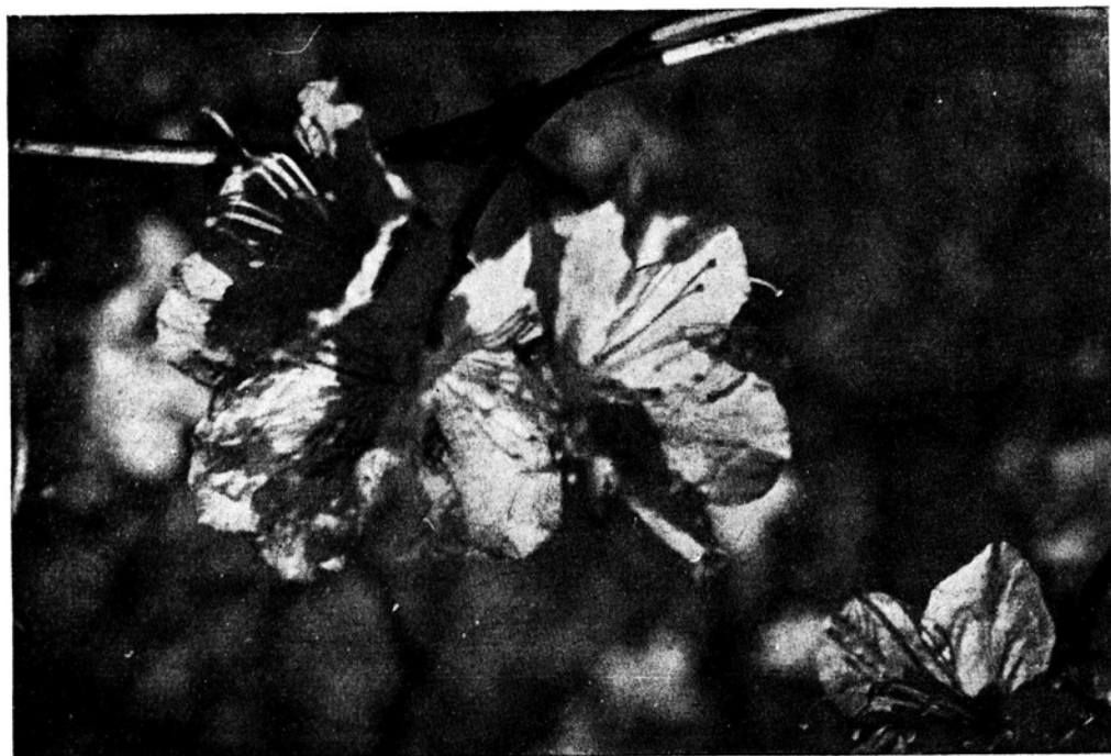
Ryc. 3. Rhododendron dauricum L. var. mucronulatum Maxim. Różanecznik dahurski

W Ogrodzie Botanicznym UW opisywany różanecznik doskonale rośnie na «torfowisku», co roku bardzo obficie kwitnie i owocuje.