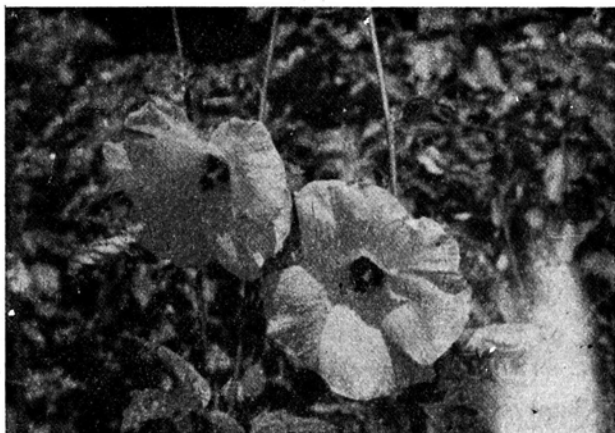
Ryc. 2. Hibiscus Manihot

Hibiscus Manihot w naszych warunkach klimatycznych jest rośliną roczną.