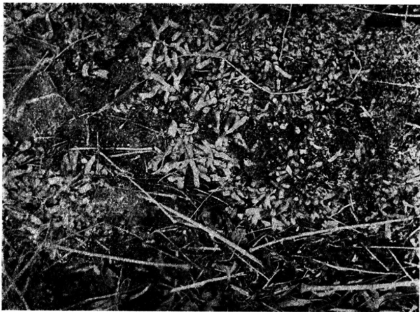
Ryc. 2. Synuzja kserotermicznych mszaków w lukach murawy Koelerieto-Festucetum sulcatae na zboczu wapiennym na Bielanych koło Krakowa. Panują wątrobowce plechowate: Grimaldia fragrans , Riccia ciliata i R. sorocarpa .