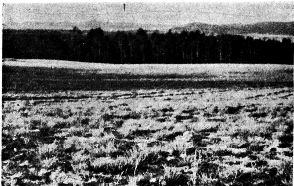
Ryc. 1. Płat zespołu szczotliczy siwej ( Corynephorum canescentis ) w okolicy Rabsztyna w Jurze Krakowsko-wieluńskiej. Na pierwszym planie widoczne dwie synuzje: skupienia kęp szczotliczy i skupienia mszaków i porostów w lukach murawy.

Najlepiej poznane są niewątpliwie naziemne synuzje mszaków i porostów, występujące w zespołach leśnych, naskalnych, murawowych i in. Badanie ich składu florystycznego nie napotyka większych trudności — wystarczają tutaj te same metody zdjęć fitosocjologicznych, jakie stosujemy do roślinności wyższej. W zbiorowiskach leśnych synuzje naziemne tworzą najniższą warstwę bądź to wykształconą bardzo wyraźnie, jak to jest np. w na-