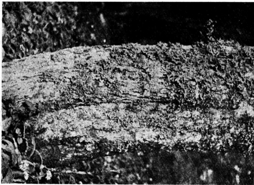
Ryc. 3. Zbiorowisko epifitów nadrzewnych na pniu jawora w zespole Fagetum carpaticum allietosum w rezerwacie im. Wł. Orkana w Gorcach.

Zbiorowiska nadrzewne wykazują bardzo ścisłą zależność od zespołów roślin wyższych, w których obrębie występują i którym zawdzięczają nie tylko podłoże, lecz i odpowiedni klimat lokalny. Zdaniem Motyki (1927) „każdy typ lasu ma swój bogaty w gatunki zespół porostów nadrzewnych“, a „nawet to samo drzewo ma różną florę epifityczną, jeśli rośnie w różnych formacjach roślinnych“. Z poglądem tym zgadza się większość autorów. Wiśniewski (1929), który w swych badaniach białowieskich doszedł do