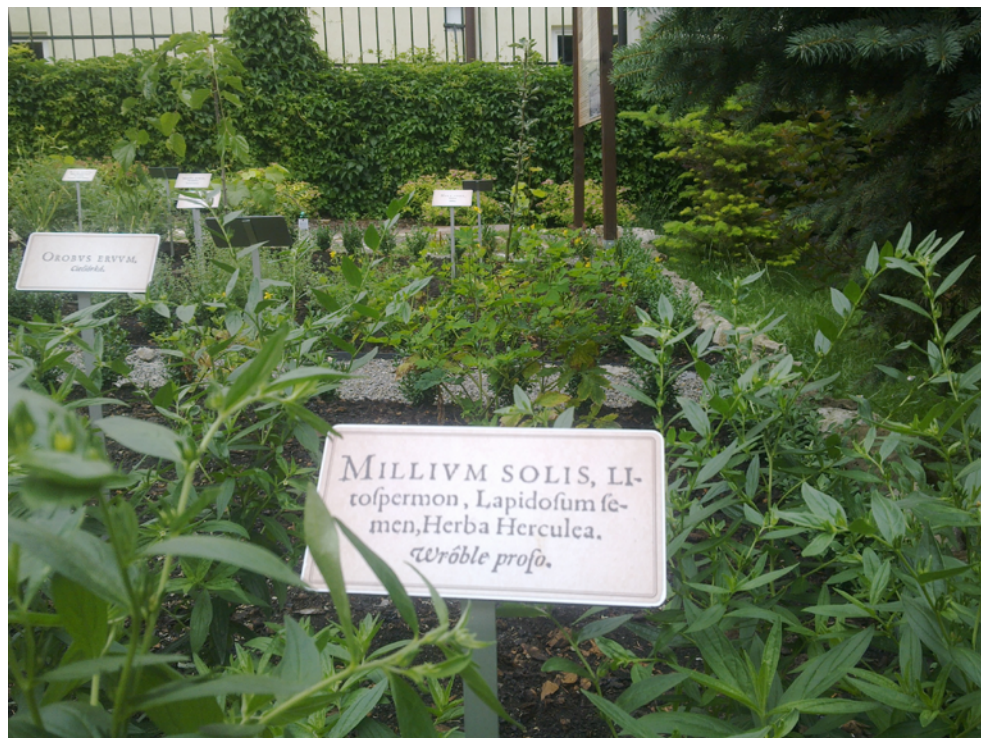
Ryc. 5. Tabliczka z nazwą gatunku rośliny w językach: łacińskim, greckim i polskim, z użyciem renesansowej czcionki przeniesionej z Herbarza polskiego.