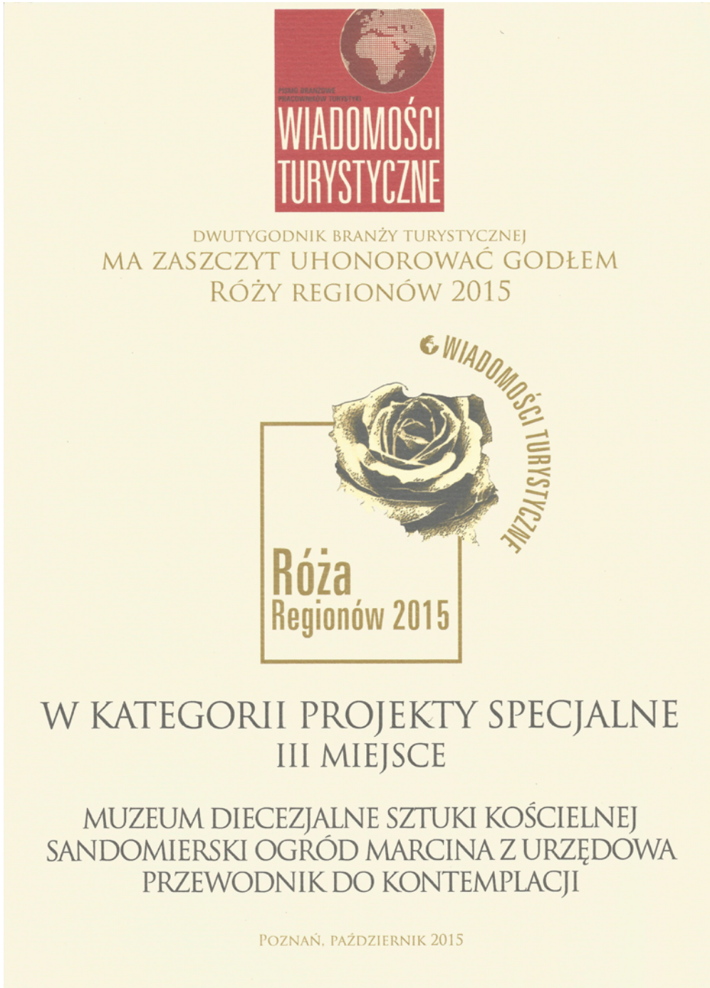
Ryc. 7. Dyplom za III nagrodę w Konkursie Róża Regionów 2015.