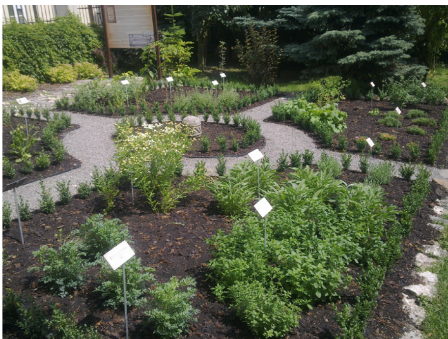
Ryc. 8–9. Widok na herbularium.