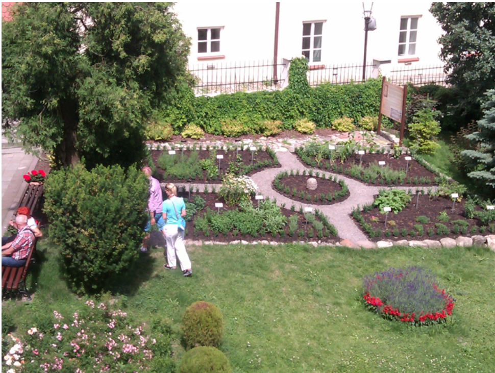
Ryc. 4. Renesansowe założenie ogrodowe, widziane z okna Muzeum.