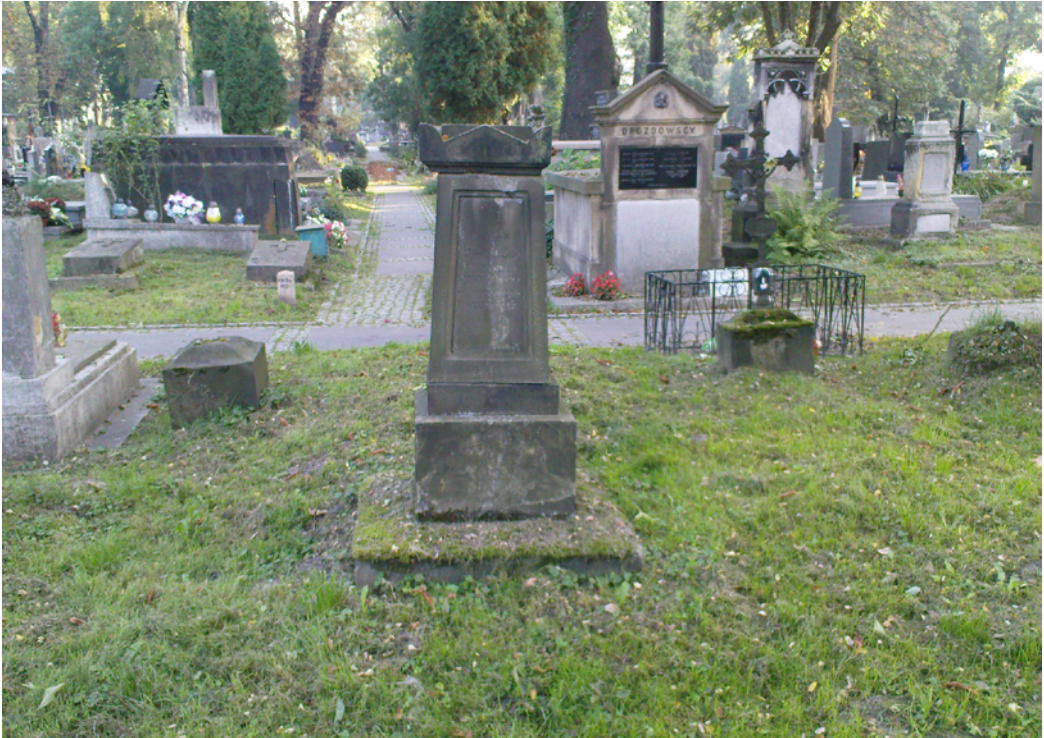
Ryc. 2. Grób, w którym pochowany jest Franciszek Herbich (fot. P. Köhler).