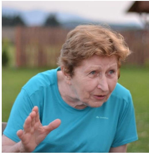
Podczas wakacji w Karkonoszach (sierpień 2020)

górskie i bezpośredni kontakt z naturą. Była licencjonowanym przewodnikiem tatrzańskim i przewodnikiem turystyki górskiej PTTK. Za swoją działalność otrzymała srebrną odznakę PTTK. Za zasługi dla Krakowa została odznaczona w 2013 roku odznaką Honoris Gratia .